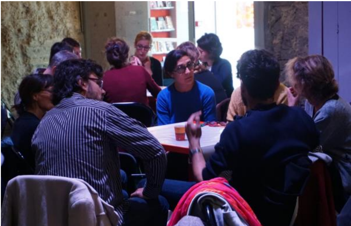
Atelier 1, Groupe 2

Selon certains participants : artistes plutôt privilégiés en termes de formation.