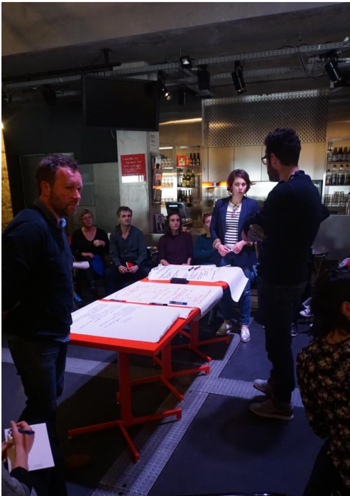
Restitution des ateliers