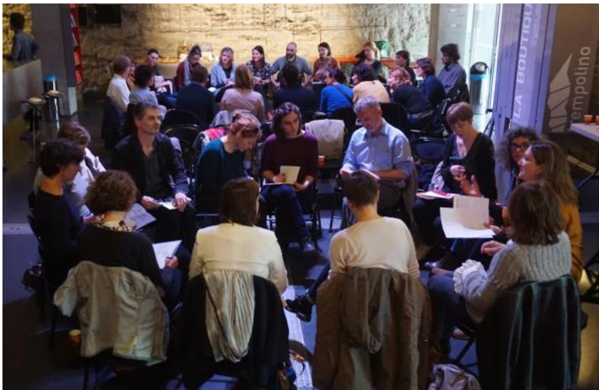
Mise en place des deux ateliers de l'après-midi