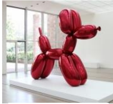
Acier inoxydable chromé Balloon dog/ Jeff Koons