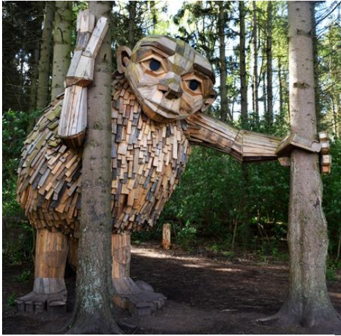
Bois - The 6 Forgotten Giants / Thomas Dambo