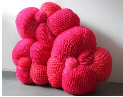
Tissu – Emilie Faïf