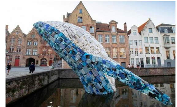
Plastique – Studio KCA - Skyscraper