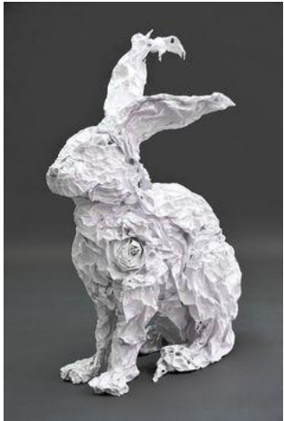
Papier - the guide - Sophie Piet