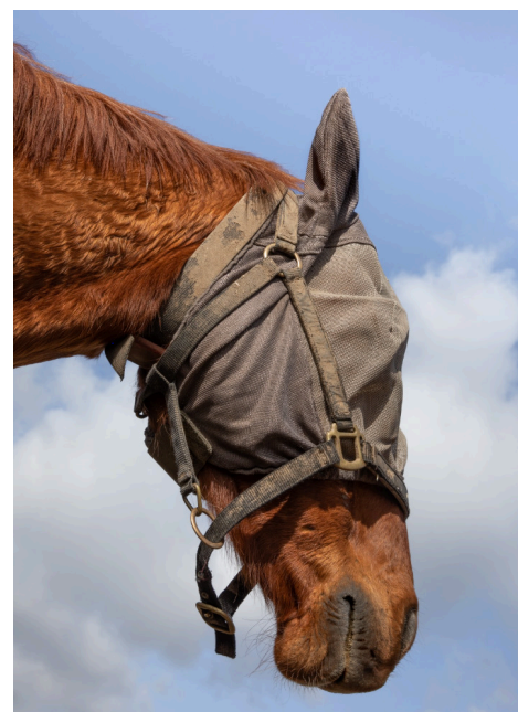
Lou Roy : Exposition Révérences - résidence ARTCHEVAL 2020