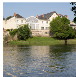
Vue de la rivière Le Thouet du Centre d'Art Contemporain Bouvet Ladubay, ce cours d'eau se jette dans la Loire à 1km