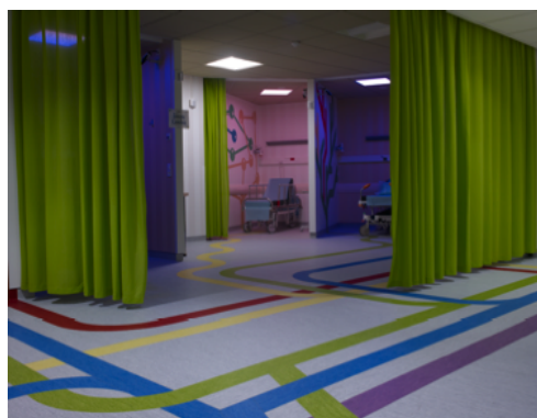
Bruno Peinado, « Sans titre : le jardin aux sentiers qui bifurquent », Institut de cancérologie de l'Ouest, Nantes.