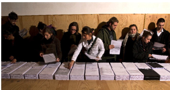
La base d'Appui d'Entre-deux : bureau de production et lieu de diffusion d'œuvres d'art public, lieu d'exposition et de consultation de documents (Avignon & Clouet architectes). TOOL BOX , exposition de protocoles d'œuvres à réaliser, 2008.