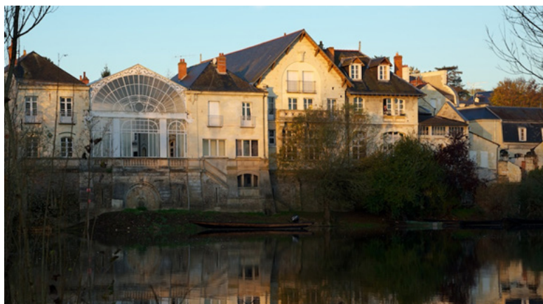
Vue de la rivière Le Thouet du Centre d'Art Contemporain Bouvet Ladubay, ce cours d'eau se jette dans la Loire à 1km