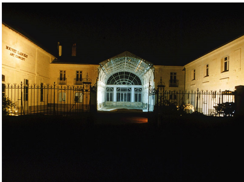
Entrée / Cour du Centre d'Art Contemporain Bouvet Ladubay – Verrière 19ème