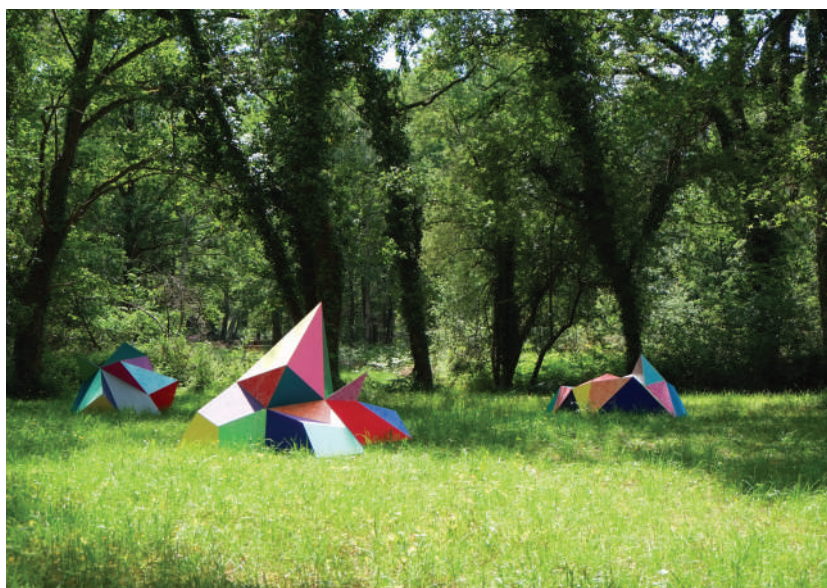
Elodie Boutry : Sous-bois - 2018