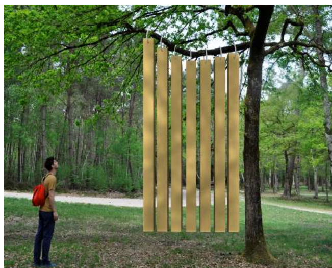
Camille Techer : the size of the container - 2019