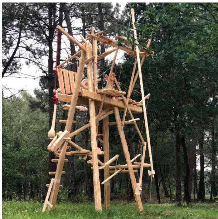
Mathieu Archambault de Beaune : Cheval, cheval, cheval, ni oui ni non - 2018