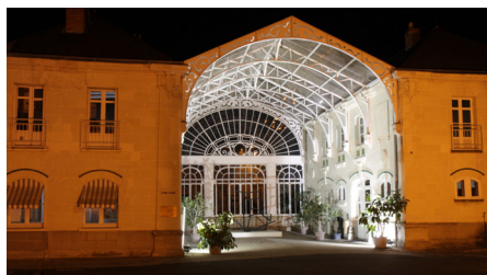
Entrée / Cour du Centre d'Art Contemporain Bouvet Ladubay – Verrière 19ème

De nombreux artistes ont exposé dans le Centre d'Art Bouvet Ladubay : Découvrez l'annuaire des artistes