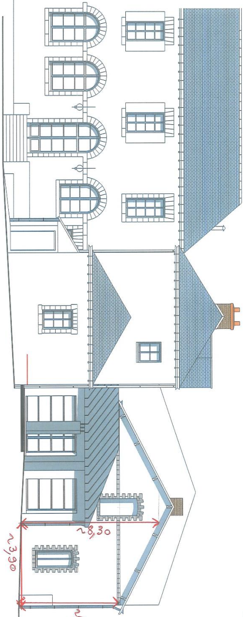
FACADE SUD PROJET