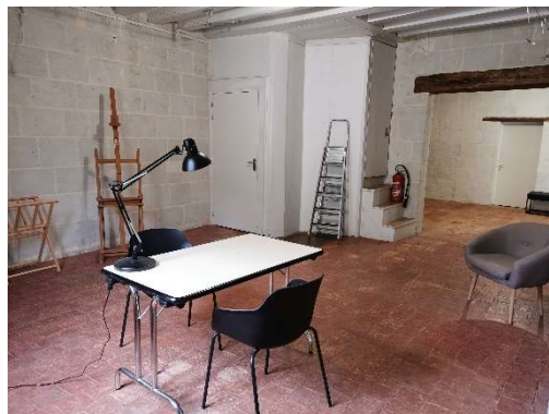
1e étage – espace de travail (étage non accessible au public)