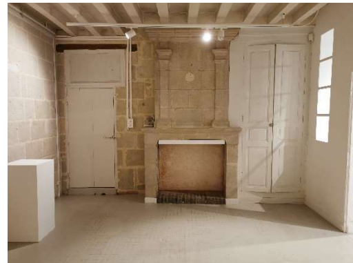
Rez-de-chaussée - pièce 3