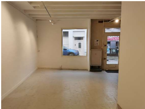
Rez-de-chaussée - pièce 2