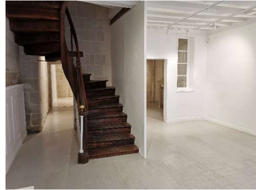
Rez-de-chaussée - pièce 2