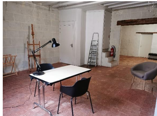
1e étage – espace de travail (étage non accessible au public)