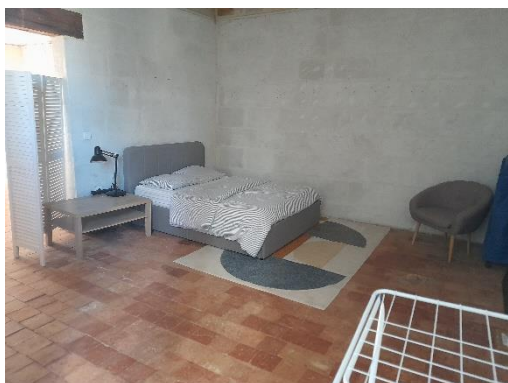
1 e étage - pièce intermédiaire