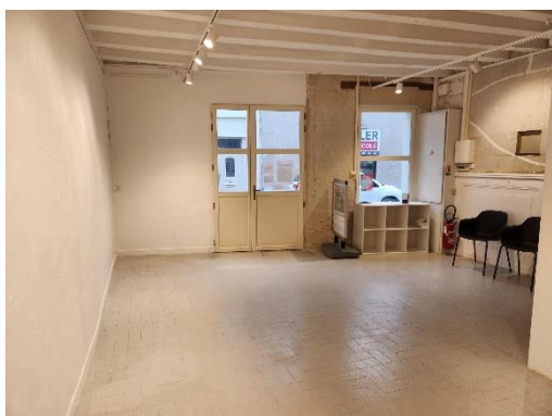
Rez-de-chaussée - pièce 1