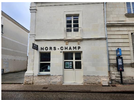
Façade de la galerie