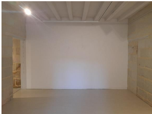
Rez-de-chaussée - pièce 3