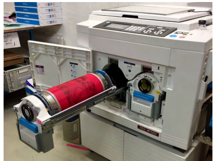
Pole print Bonus.

L'artiste disposera d'un accès aux machines de Bonus, accompagné·e de notre chargé de production, et pourra réaliser des tirages photos grands formats (jusqu'à 112 cm de large) sur des papiers variés, tout en ayant aussi accès à nos 16 couleurs riso et à la large gamme de nuanciers papiers dont dispose l'atelier. Il s'agira de produire ensemble une série ou un objet éditorial, qu'il s'agisse de dos bleu à afficher dans la rue ou d'une édition imprimée et façonnée dans nos murs. L'artiste ne pourra en revanche accéder librement aux machines et restera sous la supervision du chargé de production, dans la limite de ses disponibilités.