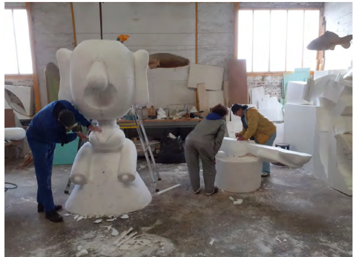
Atelier Cellule B.

Cellule B est un collectif d'artistes plasticien·nes pluridisciplinaires réunies autour de Xavier Hervouët et Cyril Cornillier. Nous créons des œuvres/installations sur commande et en collaboration avec d'autres artistes. Le collectif travaille le volume (sculpture, construction,