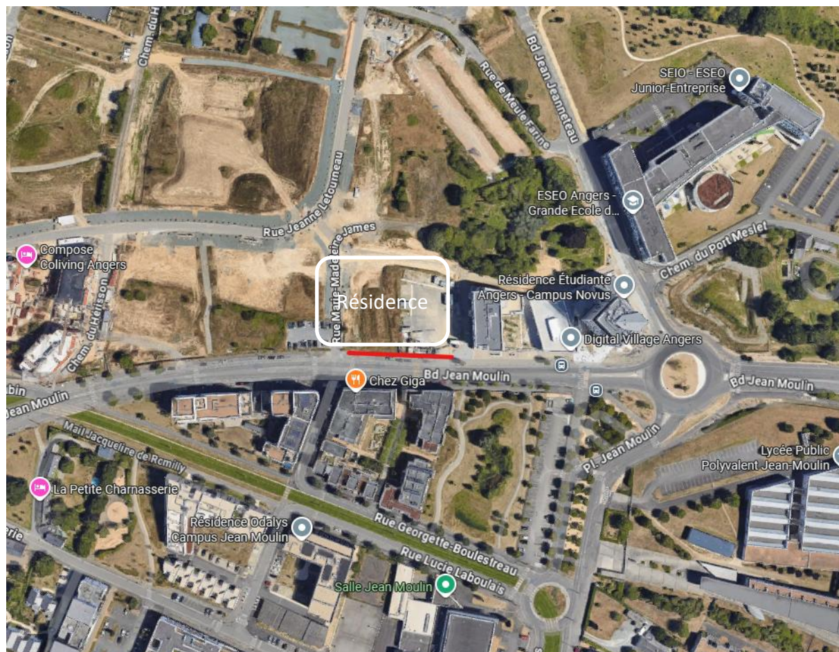
Vue aérienne du site du chantier et de la zone d'intervention pour la réalisation de l'œuvre (linéaire rouge)

Le projet peut investir tout ou partie de ce métrage linéaire. L'artiste utilisera un support à capacité de réversibilité simple, pouvant être facilement démonté ou effacé.