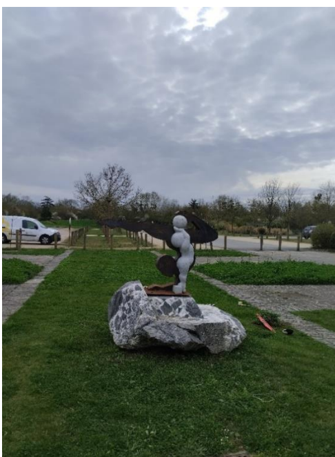
Œuvre de Coralie Quincey installée à Saint-Florent-le-Vieil- 2024