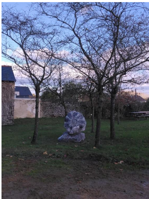
Œuvre de Giovanni Carosi installée à Bourgneuf-en-Mauges – 2025

Proposer une œuvre pérenne qui prendra place dans une commune déléguée. Voici ci-dessous quelques exemples d'œuvres installées récemment.