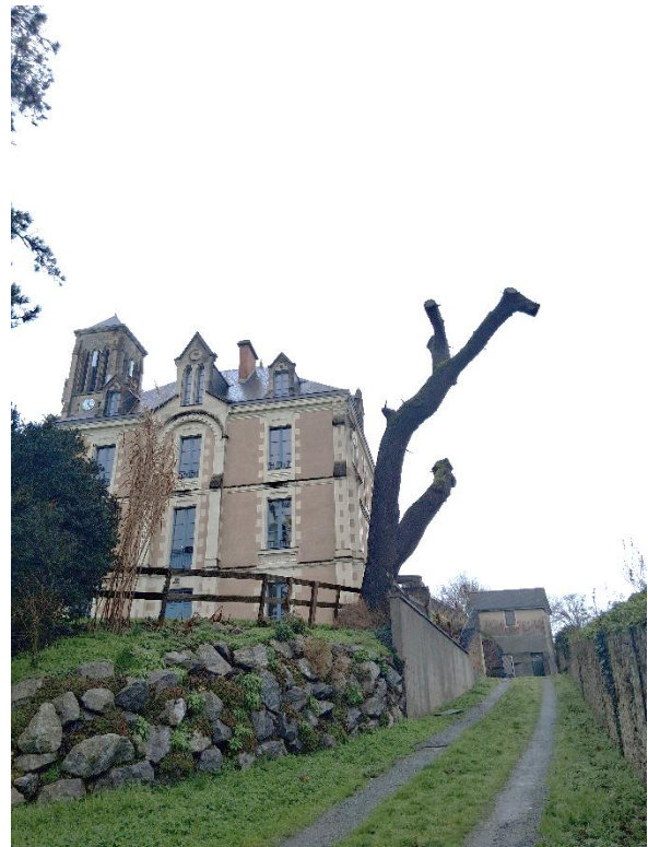
Arbre vu depuis la Mairie